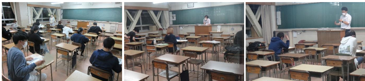
日本漢字能力検定

1年生はよりよい人間関係を築くための人との接し方について、2年生は部落差別解消の歴史について学びました。3年生は結婚差別について、4年生は新型コロナウイルス問題について考えました。